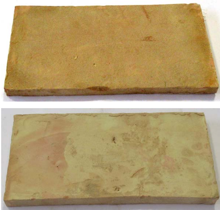
Figura 1. Riproduzione fotografica della parte frontale e del retro di un provino tal quale del prodotto "Pianella 18x36x2.5 cm Rosato".